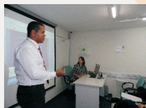
SIPAT no SETURN