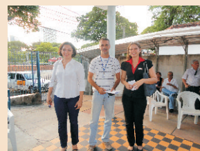
Evento interno do IBGE